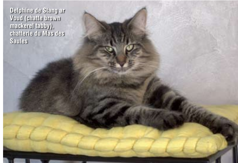
Delphine de Stang ar Voud (chatte brown mackerel tabby), chatterie du Mas des Saules