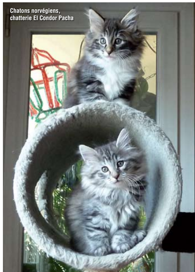
Chatons norvégiens, chatterie El Condor Pacha

Si vous habitez une maison avec un jardin, sachez le protéger des dangers de la vie citadine et des risques de promenades en campagne en limitant ses sorties. Les dangers de la vie en liberté ne font qu’abrèger son espérance de vie.